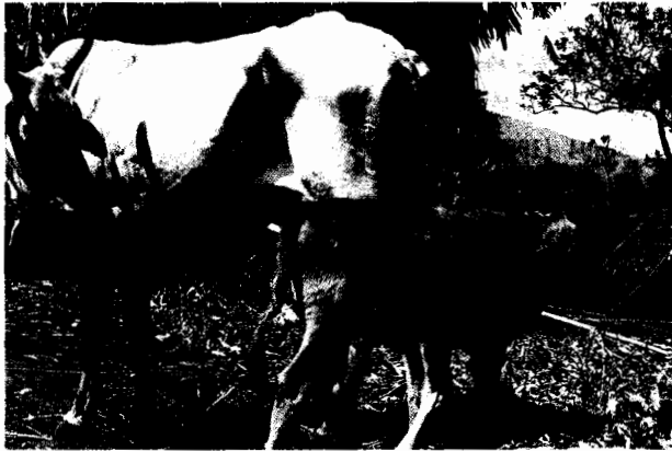
Fig. 2 The Ongole used in the study. Owner: Gerson Langi, North Sulawesi, Indonesia