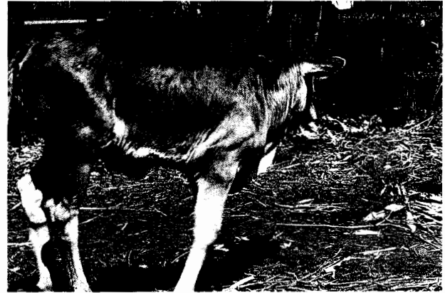
Fig. 3 The calf (F 1 ) produced in the study (Birth date: Oct. 3, 1980). Owner: Gerson Langi, North Sulawesi, Indonesia