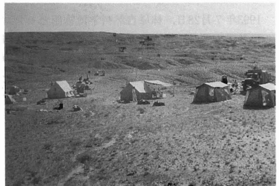
写真2 テルウランチャルツァイでのキャンプ風景（東ゴビ） この近くで恐竜の巣化石を発見した。