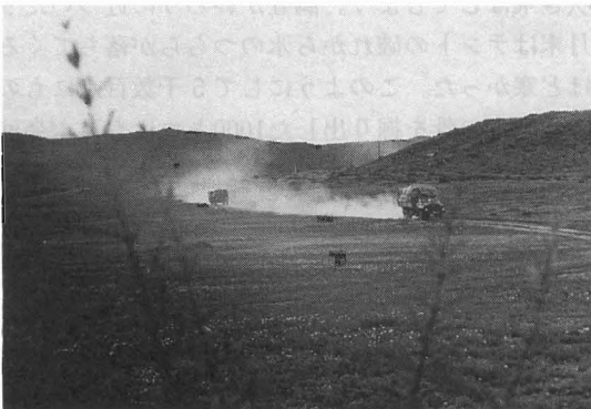
写真1 ウランバートルから最初の調査地フレンドゥフへ草原を通過