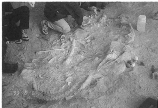
写真3 フレンドッフの下部白亜紀層からイグアノドンの埋没化石の発見