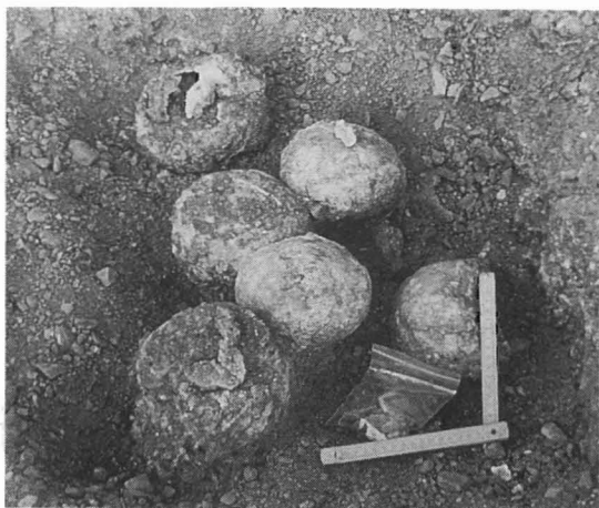
写真5 ノゴンツアフの卵の巢化石（西ゴビ） 礫の中から産出する。何の卵であるのかはまだ不明。

1993年7月28日、林原自然科学博物館とモンゴル科学アカデミー地質研究所のゴビ砂漠での共同学術調査のために、私は最初の調査地、東ゴビのフレンドッフにむかった。これから2ヵ月間の大旅行である。日本から持っていったバジェロ2台